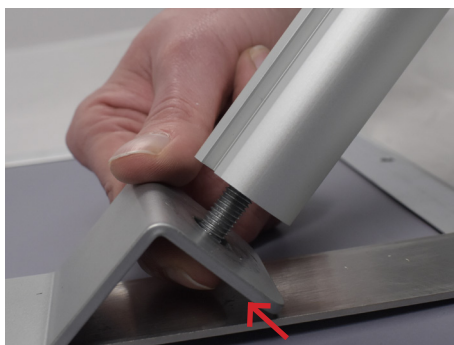
Avvitare il montante al leggjo (tenere ferma la vite con le dita).