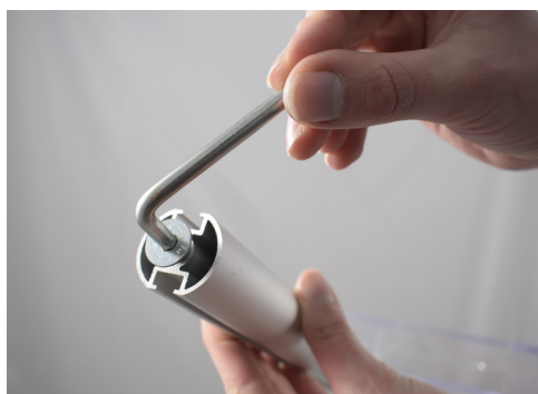
Con la brugola svitare la vite M8 dalla parte inferiore del montante.