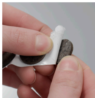
Consigliamo di applicare i feltrini alla base per non rovinare il pavimento.