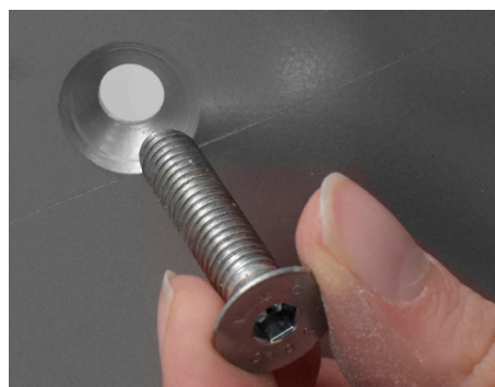
Inserire la vite M8 tolta in precedenza nel foro presente sulla base (lato con foro svasato verso il basso).