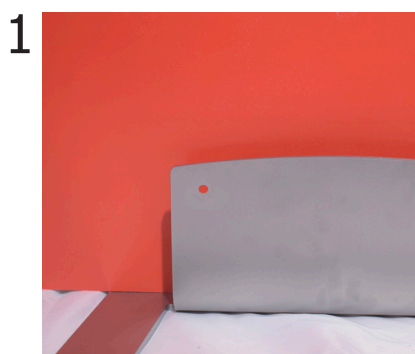
Appoggiare il pannello nel retro della base.