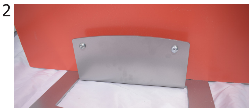
Appoggiare la staffa al pannello. Far passare le viti attraverso tutti i fori. Bloccare con rondella e dado (se necessario forare il pannello con l'aiuto di un trapano).