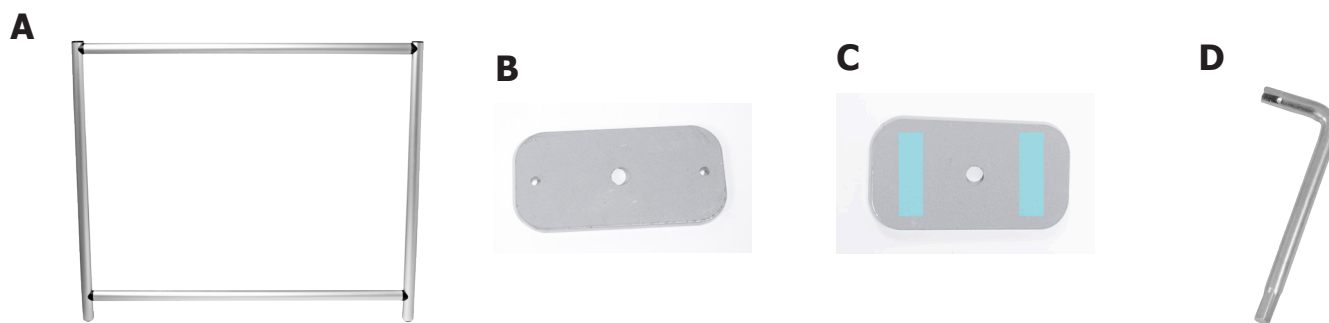
A pannello divisorio - B piedini con fori - C piedini con biadesivo - D chiavi a brugola