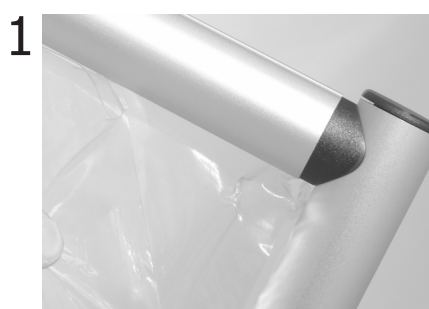
1 Rimuovere la pellicola di protezione dal pannello divisorio.