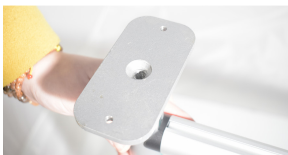
PIEDINI CON FORI Fissare il pannello divisorio al tavolo, sfruttando i fori laterali.