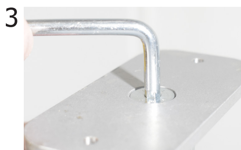
3 Unire il piedino al montante del pannello divisorio avvitando la vite rimossa nel punto precedente.