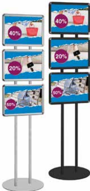
CRA106/ 206 bifacciale