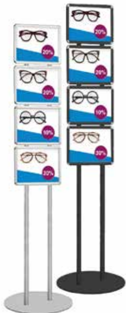
CRA105/ 205 bifacciale