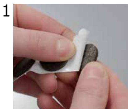
1 Consigliamo di applicare i feltrini alla base per non rovinare il pavimento.