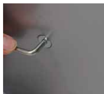
4 Unire il montante con la cornice a scatto alla base, avvitando la vite con l'aiuto della chiave a brugola. Ripetere l'operazione per l'altro montante.