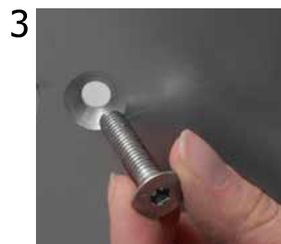
3 Inserire le viti M8 tolte in precedenza nel foro presente sulla base (lato con foro svasato verso il basso).