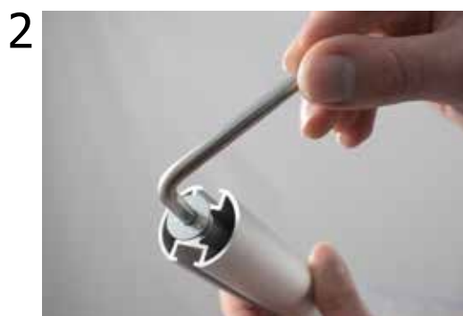
2 Con la brugola svitare le viti M8 dalla parte inferiore dei montanti.