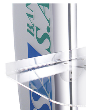
RIPIANO IN METACRILATO