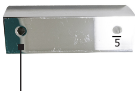
Fori per il fissaggio a muro sul retro