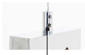
Perno removibile per fissaggio cavetto